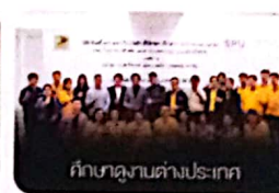
ศึกษาคุณภาพต่างประเทศ