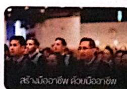
สร้างมืออาชีพ ด้วยมืออาชีพ