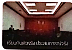
เรียนกับตัวจริง ประสบการณ์จริง