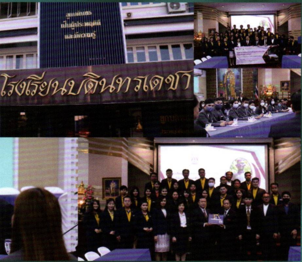
กิจกรรมศึกษาดูงานนอกสถานที่