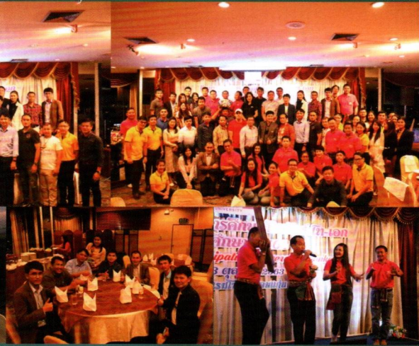
กิจกรรมบริหารการศึกษาสัมพันธ์