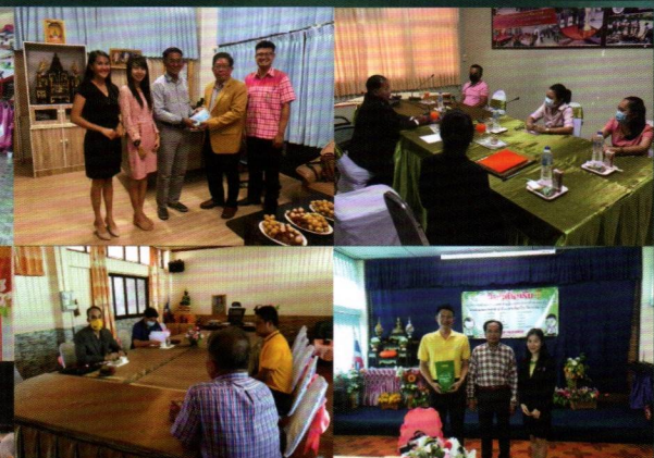
วิชาชีพผู้บริหารสถานศึกษา และผู้บริหารการศึกษา